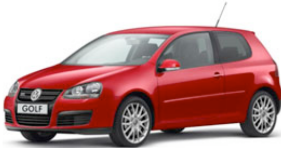
Färg: Tornado Red